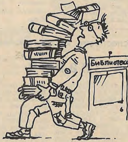
Рис. Д. Мухина.